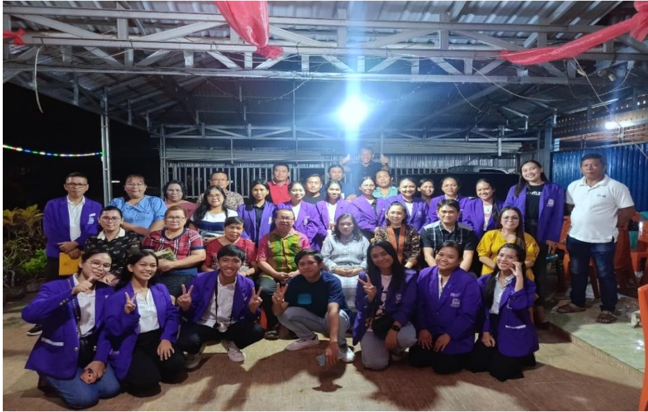
Gambar 1. Kegiatan Seminar Mahasiswa Program Studi Pastoral Konseling

kegiatan yang peduli terhadap isu kekerasan yang marak terjadi di kalangan masyarakat terutama keluarga, perempuan dan anak, pemuda.