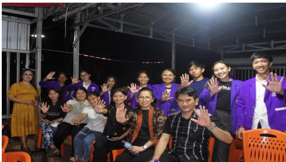
Gambar 2. Kegiatan Seminar Program Studi Pastoral Konseling

DW sebagai perangkat desa menyatakan bahwa kegiatan pengabdian kepada masyarakat yang dirangkaikan dengan seminar bertajuk gaya hidup konsumtif: kekerasan dalam rumah tangga, memberikan edukasi yang baik bagi mereka selaku perangkat desa dalam mewujudkan masyarakat yang sejahtera, aman dan damai.